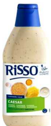
SALSA CESAR Formato: Caja 6x750 ml. Código: 8268