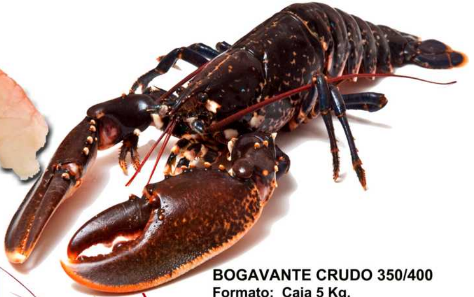
BOGAVANTE CRUDO 350/400 Formato: Caja 5 Kg. Código: 2165