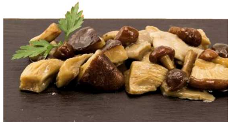
COCKTAIL DE SETAS Formato: Caja 6X750 Gr. Código: 9531