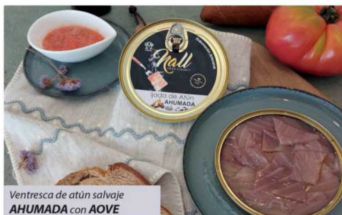
Ventresca de atún salvaje AHUMADA con AOVE