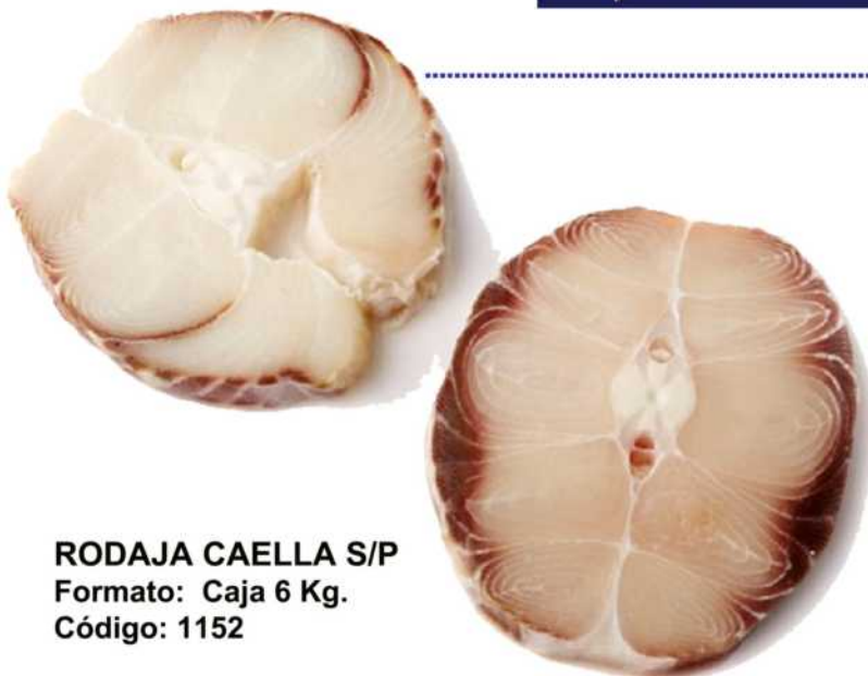
RODAJA CAELLA S/P Formato: Caja 6 Kg. Código: 1152