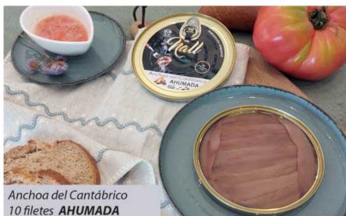
Anchoa del Cantabrico 10 filetes AHUMADA