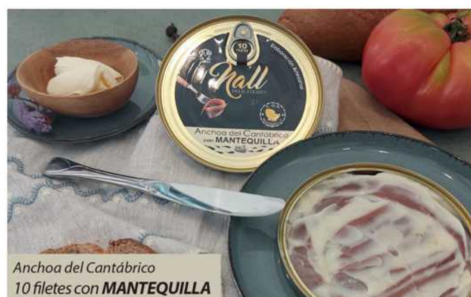
Anchoa del Cantabrico 10 filetes con MANTEQUILLA