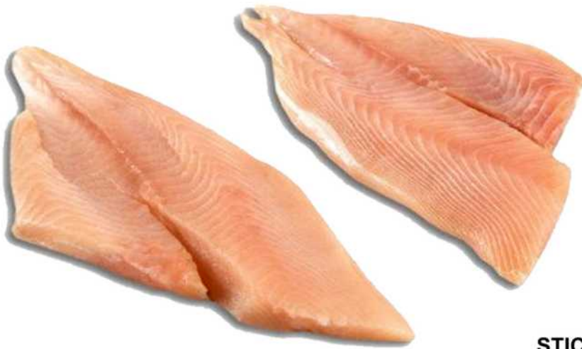
FILETE PALOMETA S/P 100/200 Formato: Caja 3x6,5 Kg. Código: 1438