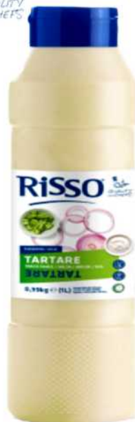
SALSA TARTARA Formato: Caja 1x6 L. Código: 8255