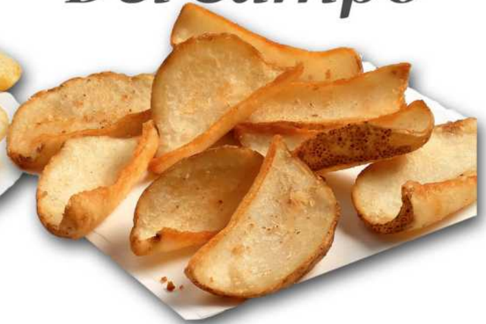
PATATA DIPPERS (TEJA) Formato: Caja 4x2.5 Kg. Código: 3372