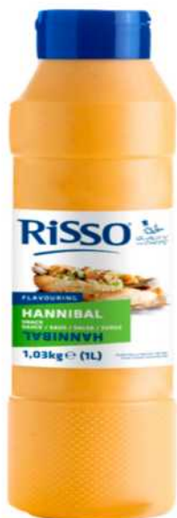
SALSA HANNIBAL Formato: Caja 1x6 L. Código: 8249