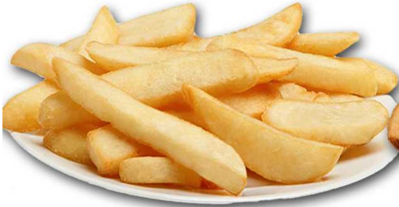
PATATA CASERA Formato: Caja 4x2.5 Kg. Código: 3227