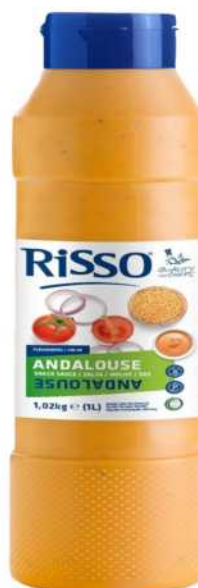
SALSA ANDALOUSE Formato: Caja 1x6 L. Código: 8246