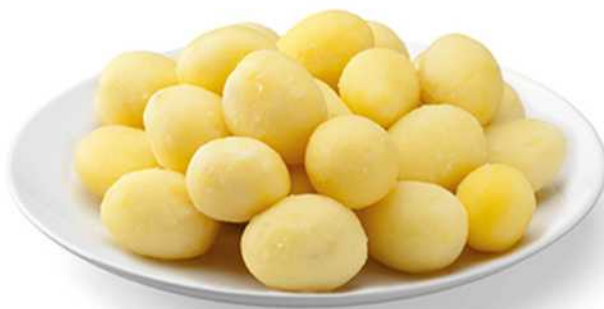
PATATA PARISINA Formato: Caja 4x2,5 Kg. Código: 4050