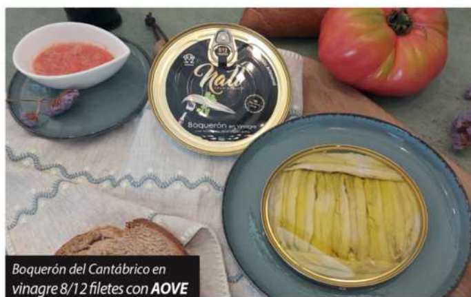
Boquerón del Cantabrico en vinagre 8/12 filetes con AOVE