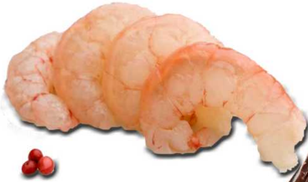
GAMBA PELADA 50/70 Código: 2049