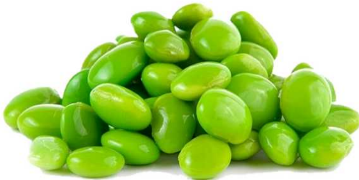
EDAMAME PELADO Formato: Caja 20x500 Gr. Código: 8308