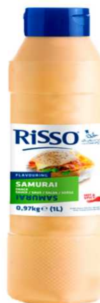
SALSA SAMURAI Formato: Caja 1x6 L. Código: 8245