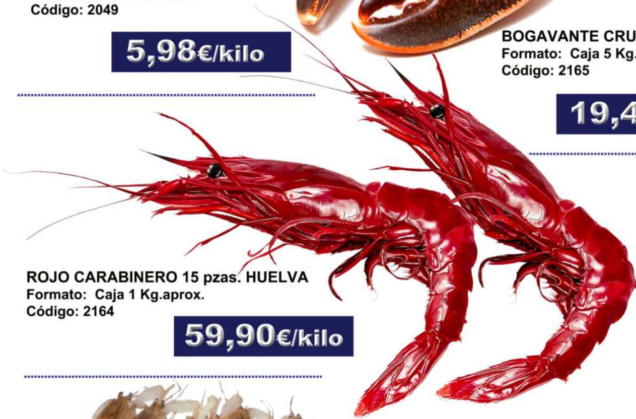
ROJO CARABINERO 15 pzas. HUELVA Formato: Caja 1 Kg.aprox. Código: 2164