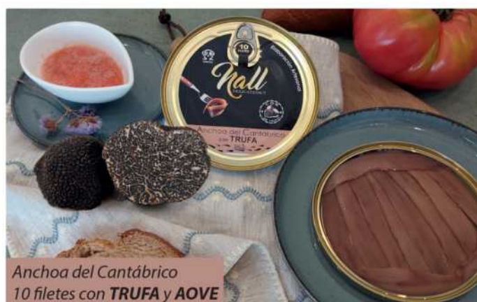
Anchoa del Cantabrico 10 filetes con TRUFA y AOVE