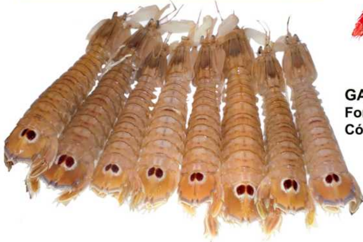
GALERA G 25/30 sopa /fideua Formato: Caja 2.5 Kg. Código: 2169