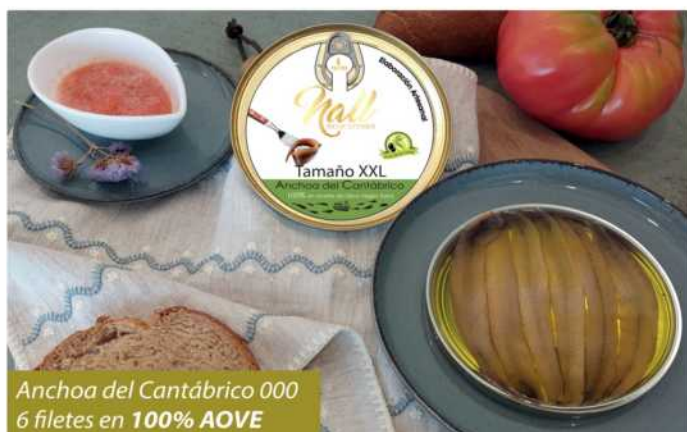
Anchoa del Cantabrico 000 6 filetes en 100% AOVE