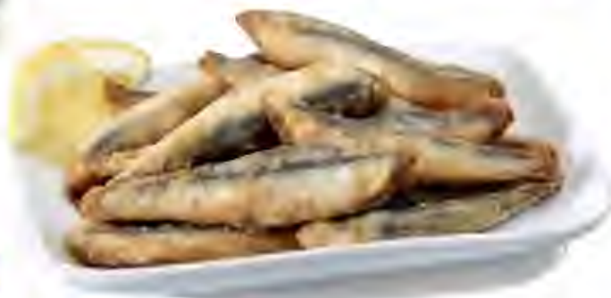
Boquerón Enharinado ibercook Formato: Caja 10x500 gr Código: 3589