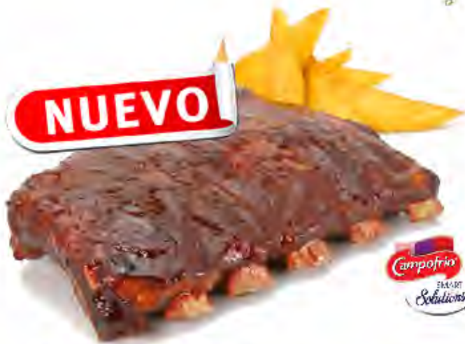
Costilla Asada Barbacoa 600gr Formato: Caja 7 kg Código: 5241