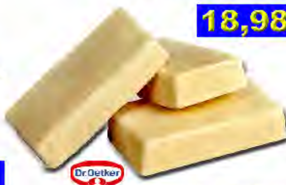
Salsa Formaggi Profesional Formato: Caja 4x1 Código: 8230

Salsa italiana de albahaca, aceite de oliva virgen extra, piñones y queso.