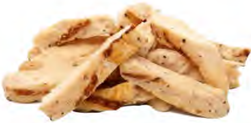
Tiras Pollo Asado Formato: Caja 1x10 kg Código: 5041