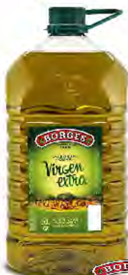
Aceite Oliva Virgen Extra Formato: Garrafa 5L Código: 8192

Salsa italiana de queso Provolone, Gorgonzola y Grana Padano.