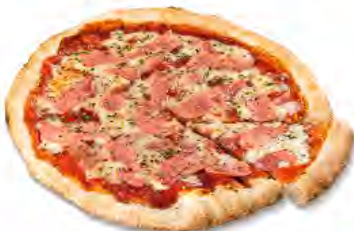
Pizza Prosciutto Formato: Caja 6x380 gr Código: 3596