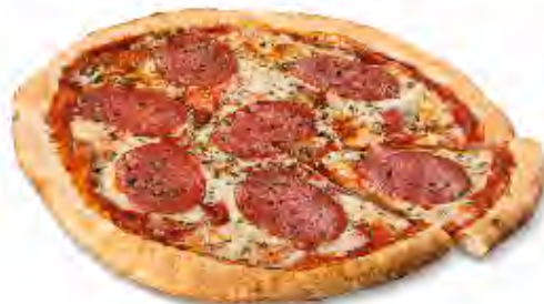
Pizza Salami Formato: Caja 6x375 gr Código: 3595