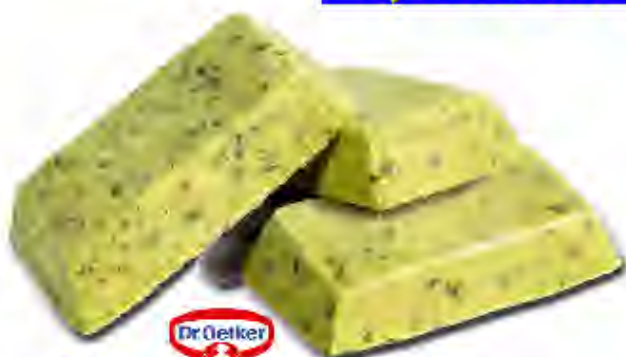
Salsa Pesto Profesional Formato: Caja 4x1 Código: 8231