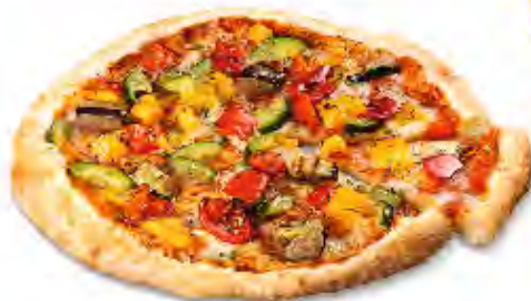
Pizza Verduras Formato: Caja 6x440 gr Código: 3598