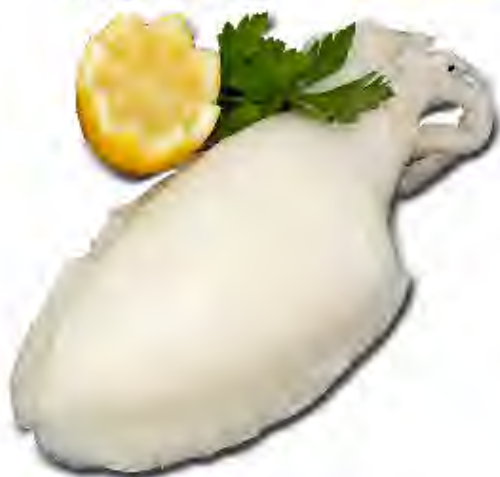
Sepia 8/12 Formato: Caja 1x6 b Código: 1186