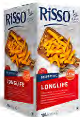
Grasa Freir Longlife Formato: Bib 10 L. Código: 8250