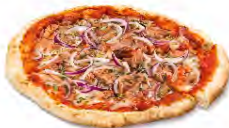
Pizza Tonno Formato: Caja 6x410 gr Código: 3599