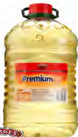
Aceite Alto Oléico Premium Formato: Garrafa 7,5L Código: 8153