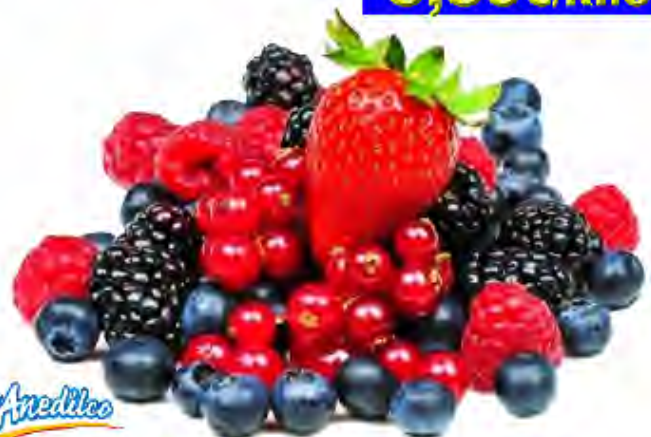
Frutos del Bosque 5 variedades