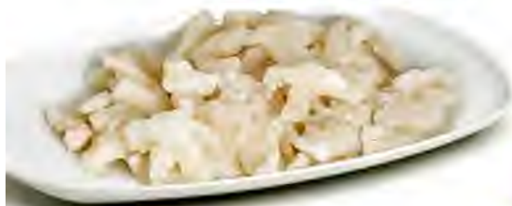
Bacalao Desmigado Formato: Caja 8x500 gr Código: 1364