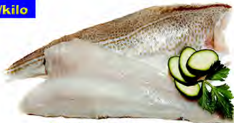
Filete Bacalao 1000+ 10% Elba Formato: Caja 11 kg Código: 1326