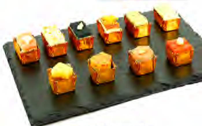
Canapes Profesional Formato: Caja 68 unds. Código: 6281