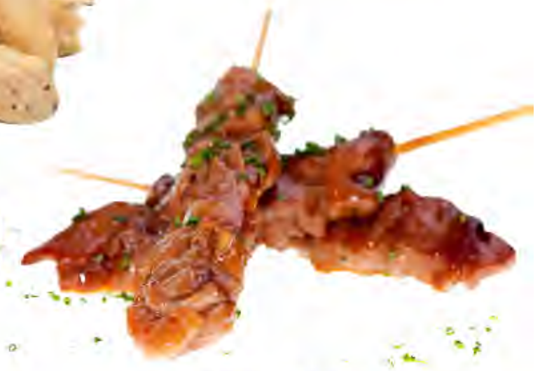
Brocheta Yakitori Satay Formato: Caja 6x1,5 (50 unds) Código: 5042