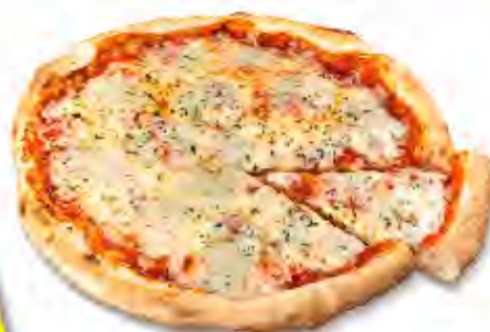
Pizza 4 Formaggi Formato: Caja 6x380 gr Código: 3597

Disponibilidad limitada. Horno de piedra en cesión por la compra de gama completa.