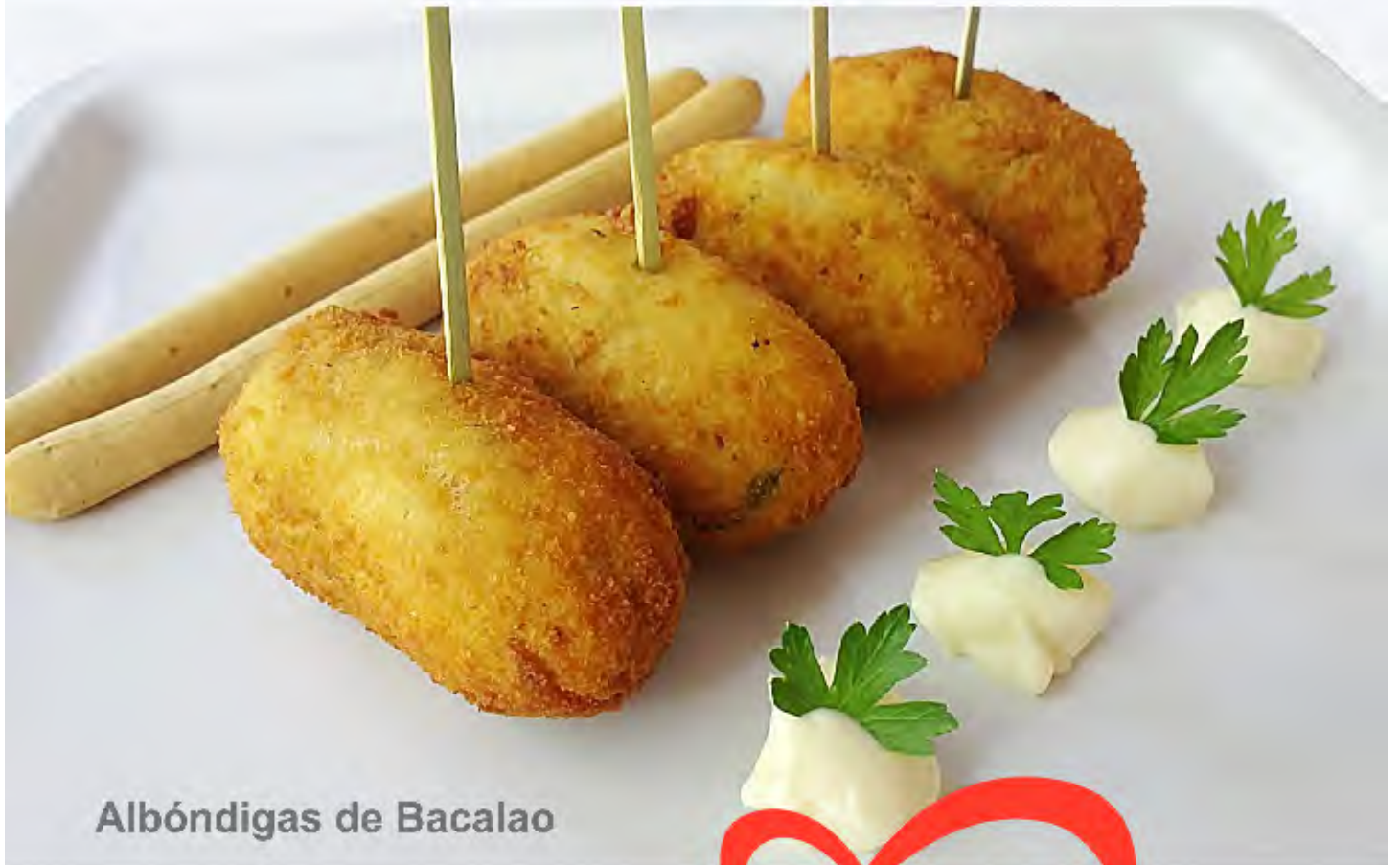
Albóndigas de Bacalao