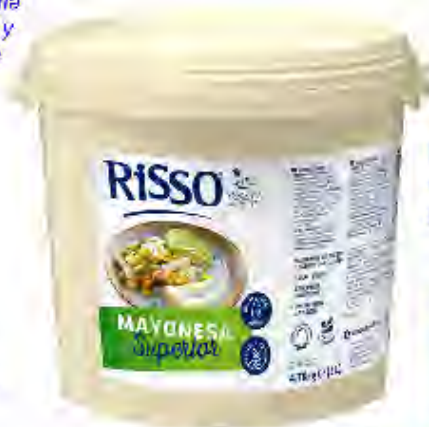
Mayonaisse Superior Formato: Cubo 5 L. Código: 8243

Salsa picante elaborada con yemas de huevos de gallinas camperas, gundilla y pimentón. Una sabrosa e intensa salsa, sin gluten y sin lactosa, ideal para combinar con snacks, pollo, carne roja y patatas bravas. Para los verdaderos amantes del picante.