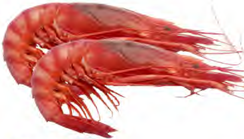
Alistado N°3 40pzas. Formato: Estuche 1 kg aprox. Código: 2054