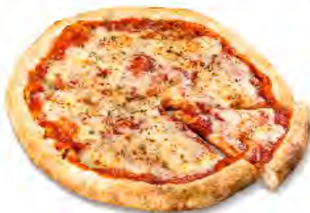
Pizza Margarita Formato: Caja 6x365 gr Código: 3594