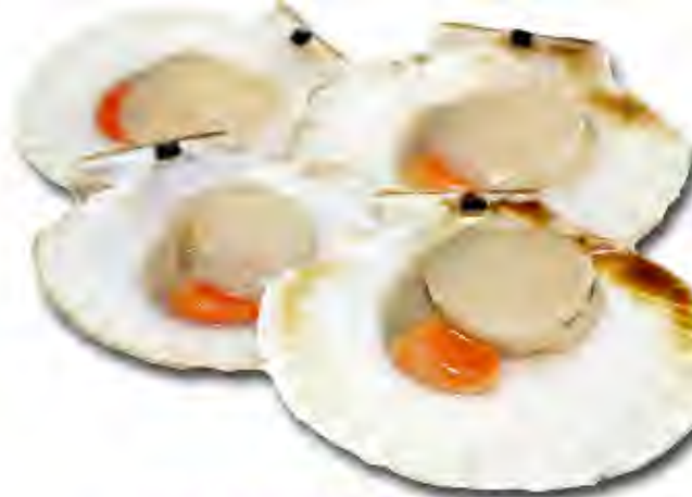
Zamburiñas 20/30 m/c Formato: Caja 8x1 kg Código: 1068