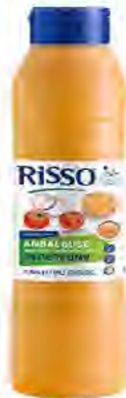
Salsa Andalous Formato: Biberón 1 L. Código: 8246

Descubre esta deliciosa salsa ligeramente dulce y especiada con trocitos de cebolla tostada que dará un toque crujiente a todas tus elaboraciones. Óptima para toda clase de finger food y platos tanto de carne como de pescado.