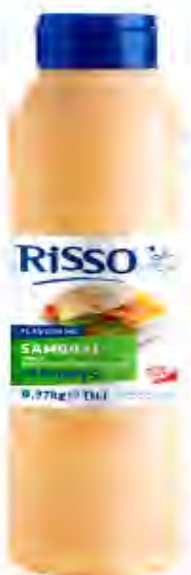
Salsa Samurai Formato: Biberón 1 L. Código: 8245

Salsa un punto especiada elaborada con tomate, cebolla tostada, pimentón y hierbas aromáticas. Añade un toque de sabor a todos tus platos de carne y patatas fritas con esta deliciosa salsa.