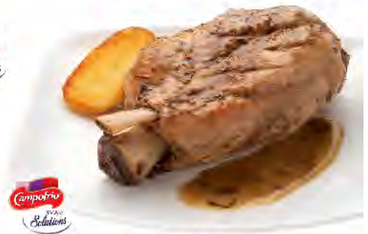
Codillo Asado 600gr Formato: Caja 12 unds. Código: PC59101