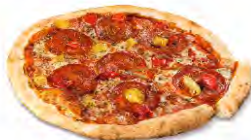
Pizza Calabrese Picante Formato: Caja 6x405 gr Código: 3601