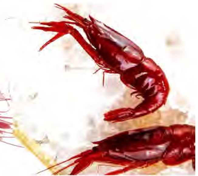
Camarón Rojo Formato: Estuche 2 kg aprox. Código: 2017