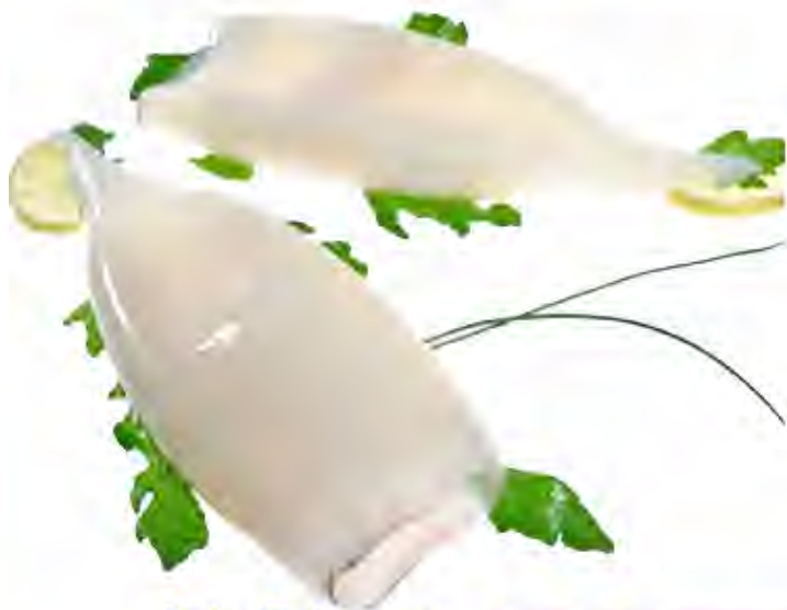
Tubo Pota Konex Formato: Caja 5 kg Código: 1211