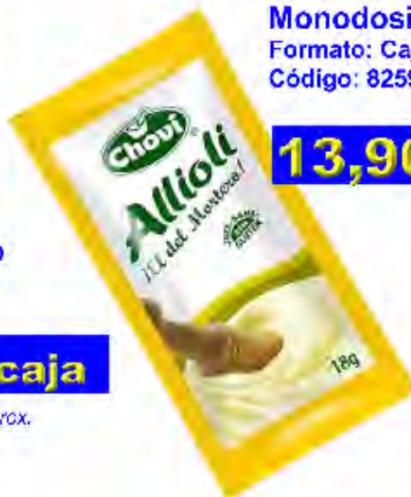
Monodosis Allioli Formato: Caja 140 unds. Código: 8259