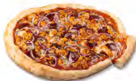
Pizza BBQ Pollo Formato: Caja 5x445 gr Código: 3600