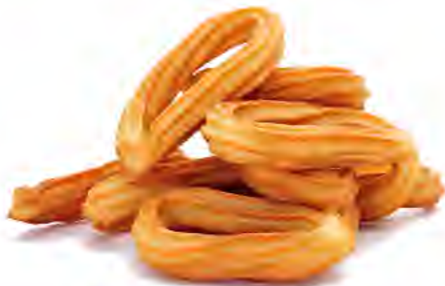
Churros Lazo Formato: Caja 3 kg Código: 3100